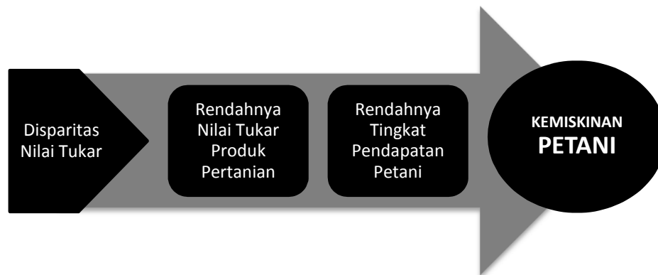
Gambar 3. Rantai Fungsi Sebab Kemiskinan

Enam kerangka definisi di atas diperlukan untuk mengurai lebih jauh apa dan bagaimana terjadinya disparitas nilai tukar antara produk pertanian dengan non-pertanian. Tapi tulisan ini akan dicukupkan sampai di sini dengan sebuah kesimpulan bahwa Fungsi Sebab (F 1 ) dari kemiskinan petani adalah karena adanya disparitas nilai tukar yang tidak proporsional antara produk pertanian dengan produk non-pertanian.