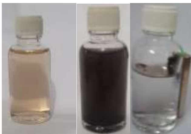
Gambar 3. Buangan akhir POME sebelum, ketika dan setelah proses adsorpsi menggunakan magnetic biochar