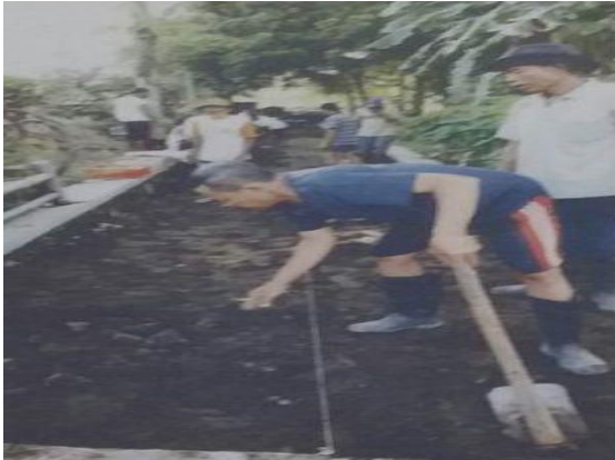
Gambar 3. Gotong-Royong Cor Blok Jalan Padukuhan