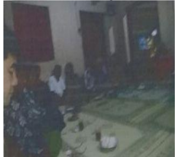
Gambar 2. Pertemuan Bulanan Warga

Penyaringan aspirasi masyarakat dalam perencanaan kegiatan pemanfaatan Dana Desa adalah melalui Dukuh dan Tokoh Masyarakat, sesuai pernyataan Sularti Staf Seksi Kesejahteraan: