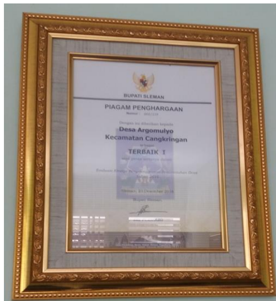
Gambar 5. Piagam Terbaik I dalam Evaluasi Kinerja Penyelenggaraan Pemerintahan Tingkat Kabupaten

Namun demikian, sejatinya akuntabilitas dapat diakui bersama bila masyarakat sebagai pihak yang berhak mendapatkan transparansi dan pertanggungjawaban dari Pemerintah Desa, mendapatkan haknya secara utuh. Sehingga harus ada langkah strategis Pemerintah Desa agar transparansi informasi dan pertanggungjawaban bisa mencapai seluruh lapisan masyarakat. Maka, nantinya masyarakat dapat menjadi pengawas seutuhnya terhadap pemanfaatan Dana Desa, khususnya di Desa Argomulyo.