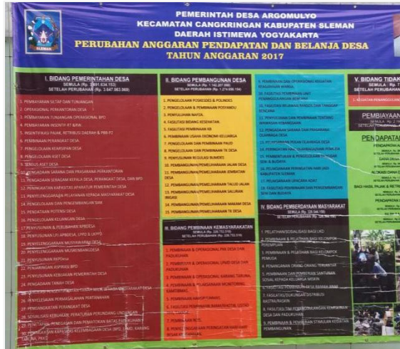
Gambar 1. Baliho tentang Dana Desa di Desa Argomulyo

Dokumen-dokumen yang berkaitan dengan Dana Desa seperti RPJMDes, RKPDes, APBDes dapat diakses secara umum. Untuk bentuk pertanggungjawaban kepada publik setiap tahunnya dikeluarkan IPPD sebagai laporan kepada masyarakat.