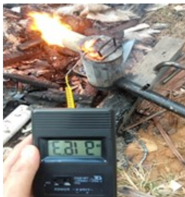
Gambar 2. Pengukuran temperatur tungku burner

pengujian dilakukan selama 45 menit menggunakan alat ukur thermometer digital TM-902C dengan meletakkan ujung sensor probe thermometer ke dalam tungku. Pengukuran tungku burner pada Gambar 2, dibawah ini :