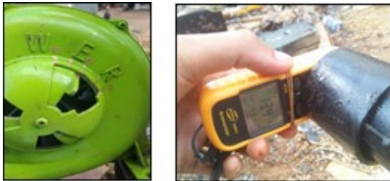
Gambar 1. Pengukuran kecepatan udara

Pada penelitian kali ini metode yang digunakan ialah metode dengan eksperimen langsung bahan yang digunakan tungku burner menggunakan blower listrik dan ruang pembakaran incinerator untuk pengambilan data laju aliran massa udara menggunakan alat ukur anemometer diletakkan diujung pipa output dari blower listrik yang ditunjukkan pada Gambar 1. untuk mencari kecepatan udara terlebih dahulu.