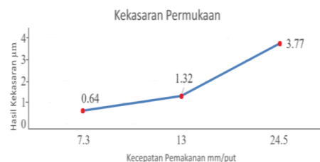
Gambar 5. Grafik Kekasaran