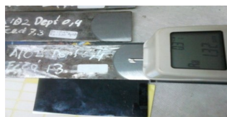
Gambar 4. Hasil Kekasaran