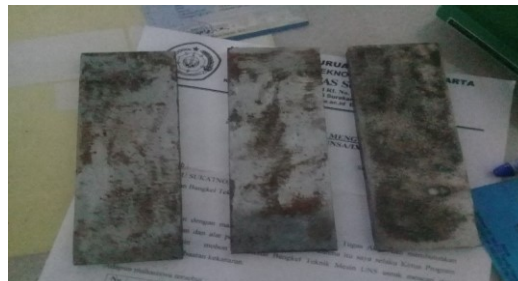
Gambar 3. Baja ST 37

Material uji yang digunakan Material baja ST 37