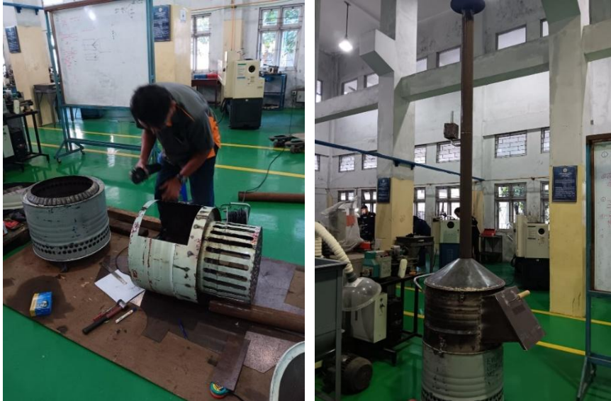
Gambar 4. Proses fabrikasi (kiri) dan prototipe alat pembakar sampah portabel (kanan).

Dalam pelaksanaannya, selama proses fabrikasi pembuatan alat pembakar sampah portabel ini diperlukan beberapa perubahan dan modifikasi dari gambar desain yang sudah dibuat, dengan beberapa pertimbangan di lapangan. Gambar 4 menunjukkan proses fabrikasi dan prototipe alat pembakar sampah portabel yang dihasilkan.