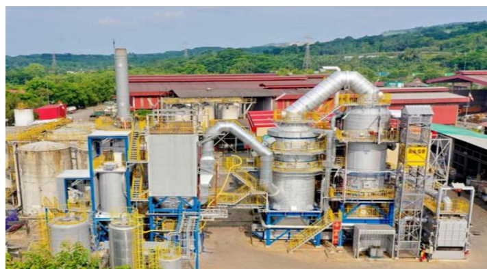
Gambar 1. Insinerator skala industri.