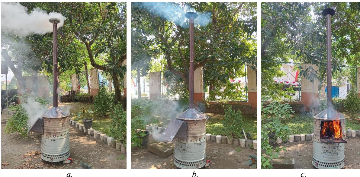
Gambar 5. Proses pengujian fungsional alat pembakar sampah portabel.

Pengujian fungsional alat pembakar sampah portabel dilakukan dengan membakar sampah daun-daun kering dari lingkungan sekitar. Proses penyalaan api pada pembakaran awal cukup dilakukan dengan membakar bahan sampah yang mudah terbakar seperti kertas atau daun kering. Selanjutnya api akan membesar hingga sampah habis terbakar. Gambar 5 menunjukkan proses pengujian.